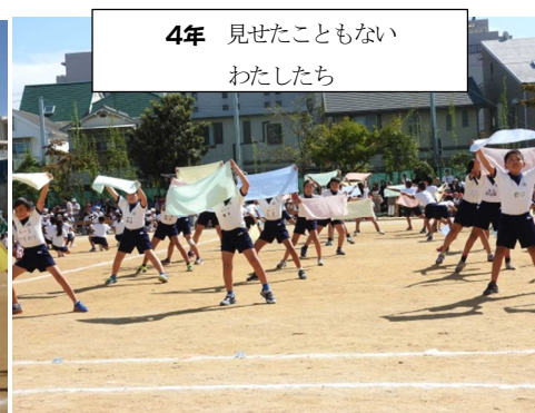
4年 見せたこともない わたしたち