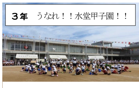
3年 うなれ！！水堂甲子園！！