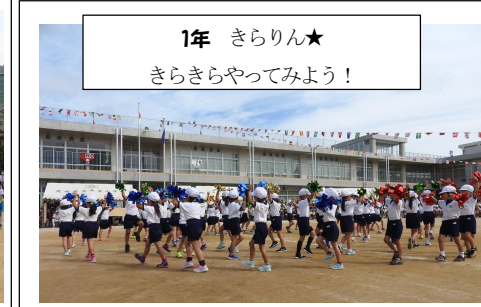
1年 きらりん★ きらきらやってみよう！

地域の方々の協力により、無事体育大会を終えることができました。どの学年も練習の成果を存分に発揮し、素晴らしい演技をすることができました。6年生は、小学校最後の体育大会ということで、演技を終えた児童の顔には達成感がにじみ出ていました。