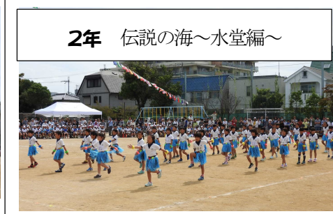
2年 伝説の海～水堂編～