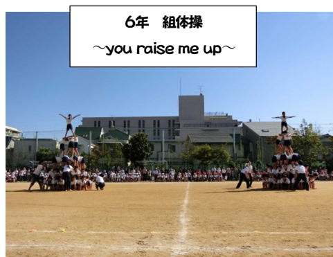
6年 組体操 ～you raise me up～