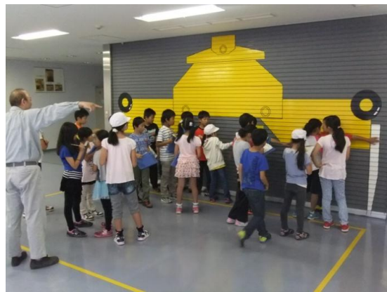
ゴミクレーン(実際の大きさを体験)