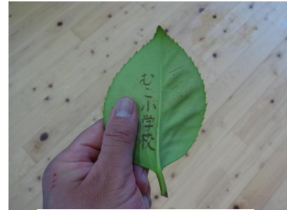
タラヨウの葉っぱ