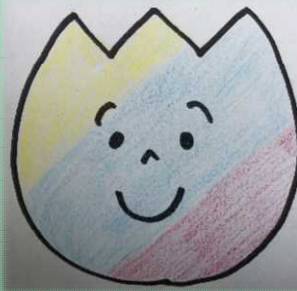
じんない せんせい

おうちでは、らしお たいそうを してい ます。しせいがよく なって すつきり す るので おすすめで す。えいがの めいたんていこなん 「名探偵コナン」が すきななので、よく みています。 おもしろいです！