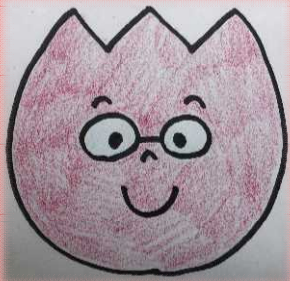
1くみ まきの せんせい