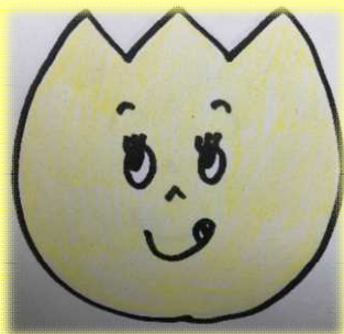
3くみ いしたに せんせい

でいずにーの れし びで、ちゅうすを つくって でいずに ーえいがや しょー をみながら たべて います！ たくさんたべてしま うので、きんとれも しながら すごして います！