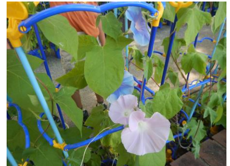
1年生の朝顔も咲き始めました

(めあて)を考えたと思います。学期の目標が計画(PLAN)です。次に、目標達成するために実行する(DO)があります。ここまでは、どの児童もできていますが、次に目標を達成するため行動したことを振り返る自己評価(CHECK)が大切です。一人ひとりがしっかり振り返り、次の改善(ACTION)に繋げて、より良い自分へ成長してほしいと思います。4月の学校だよりでも伝えましたが、学校は自分を成長させる場です。いい夏休みが迎えられるよう残りの時間を大切に過ごしましょう。