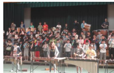
合奏の練習に励む6年生 「カルメン」第一幕への前奏曲

さて、来週の11月6日(児童)・7日(保護者)は2年ぶりの音楽会を開催いたします。体育大会の感動から1ヶ月が経過し、今度は芸術(音楽)で感動を伝えたいと、子どもたちは音楽会の仕上げに向けて練習に励んできました。日毎にリズムがそろい、メロディーが美しく教室や廊下にも聞こえてくるようになりました。音楽会まで1週間となり、保護者の皆様もきっと心待ちにされていることでしょう。その期待に応えられるよう取り組んでまいります。