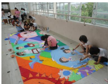
3階渡り廊下で制作中の様子 (4年生)