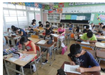
サマースクール(6年・1年)

2学期がよいスタートが切れますように、お子様の見守りと応援をよろしくお願いします。