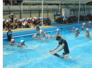
夏休み自由水泳・指導の様子