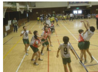
校内バスケットボール大会の様子

さて、2月は今年度最後の授業参観・懇談会があります。ぜひご来校いただき、子どもたちの1年間の成長を感じていただけたらと思います。ご協力をよろしく願います。