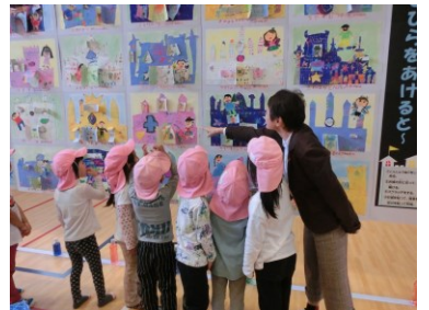
【保育所の子どもたち】