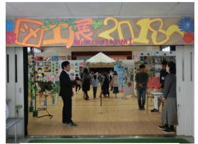
【一般・保護者鑑賞】