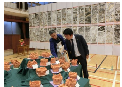
【教育長と稲嶺先生】