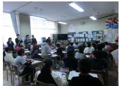
【市内外国語研究授業】