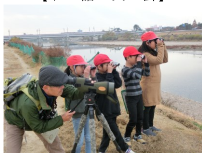
【バードウォッチング】