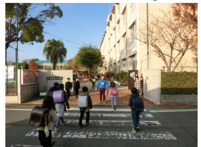
【朝のあいさつ運動】