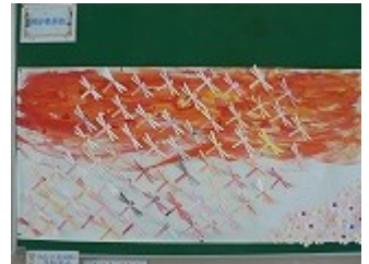
掲示委員会より 「赤とんぼ」

さて、8月中旬から2学期が始まり、2ヶ月半が経過しました。行事が続く2学期ですが、少し自分自身の学習について振り返ってみましょう。そこで、『武庫南っこ 3つの柱』の一つ「根気よく学び」について考えてみました。次に書くことはみなさんへのアドバイスです。ぜひ、毎日の学習の心構えにしてください。