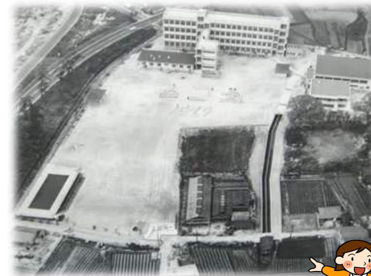
昭和44年当時の学校の様子です