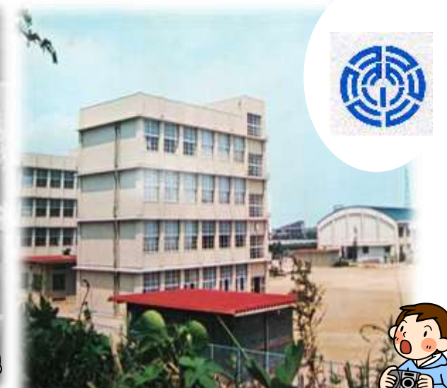
南校舎が西半分しかない時の様子