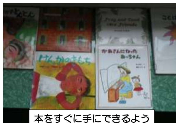
本をすぐに手にできるように平置きにしています

保護者の皆様には日頃より『早寝、早起き、朝ご飯』・『あいさつ』等の基本的な生活習慣を身につけるおねがいしておりますが今後も継続して頂けたらと思います。