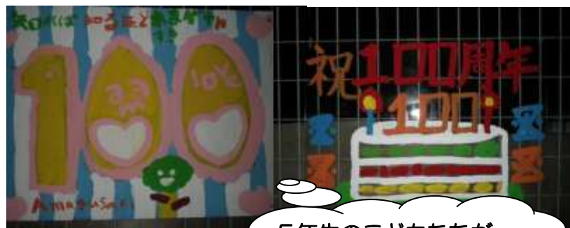
5年生の子どもたちが制作しました