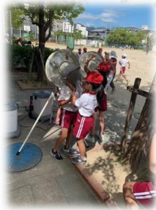
ベルマークで購入していただいた ミストファン、大活躍!!

いよいよ10月です。「暑さ寒さも彼岸まで」と言いますが、今年 は異例の暑さが続いています。朝晩は過ごしやすくなってきま したが、昼間は熱中症にまだまだ注意が必要です。今年は4年ぶりに、ご 家庭ごとの観覧人数を制限しない体育大会を行います。「命の水をチャ ージ！」を合言葉に、自分や友だちの身体を大切に、無理のない よう体育大会の練習に取り組んでいます。509名の子どもたちが、 「いきいき」そして「のびのび」と競技や演技を披露する姿を直にご 覧いただきたいと思います。ご家庭におかれましては、熱中症対策 のため引き続き帽子や水筒の用意をよろしくお願いいたします。