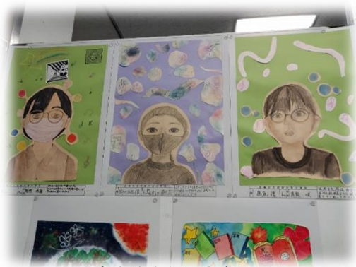
<児童生徒文化発表会図工展 に出品された作品です>