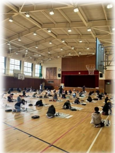
<書き初めの様子です>