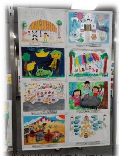
<児童生徒文化発表会図工展 に出品された作品です>