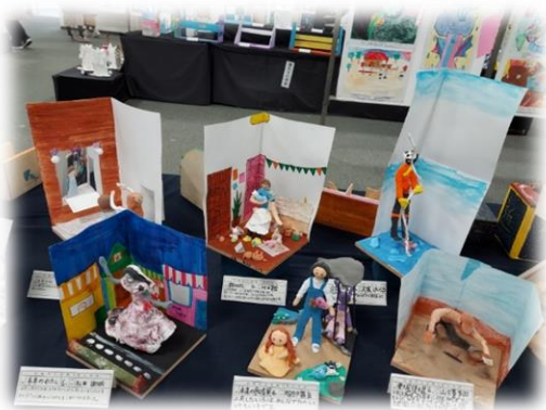
<児童生徒文化発表会図工展 に出品された作品です>