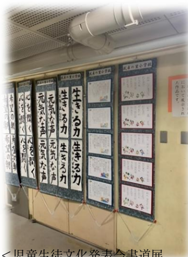
<児童生徒文化発表会書道展 に出品された作品です>