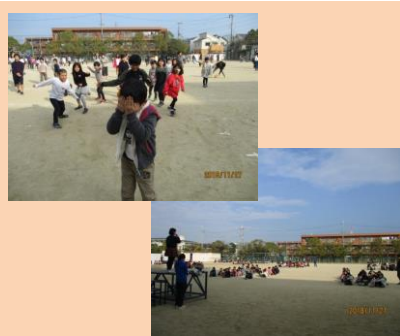
さとっこタイムの様子