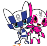
マスコットイラストの使用が公式認証されました