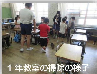
1年教室の掃除の様子

1年生の子どもたちも少しずつ学校生活に慣れてきました。自分たちのことは自分たちでできるようになってきています。