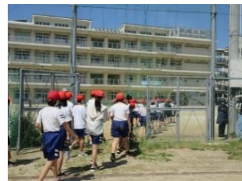
小中の間にあるフェンスを行き来

き、先輩や先生と交流していくことが心にあるフェンス（不安など）を取っ払うことにつながればと考えています。