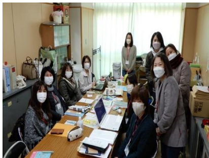
執行部のみなさん

宮会長をはじめ、PTA 執行部のみなさんにはいつも子どもたち・学校を陰ながら支えていただきました。タブレットバッグの予算執行やかるがも登校、その他中止になった行事についても常に人員の配置等、準備をしていただいていた。それぞれにお仕事等もあったとは思いますが、執行部のみなさ