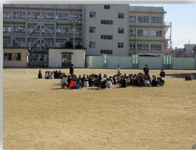
運動場で遊んでいた子どもたち

1995年1月17日、午前5時46分。阪神・淡路地域に大きな地震が起きました。あれからもう28年という月日が経ちました。この大震災で亡くなられた方は、これまで6434人にのぼります。新聞やメディア等では、震災の記憶の継承の大切さと復興の難しさが報道されていました。この震災を教訓にして、自分たちの命を守ることの大切さを改めて感じています。