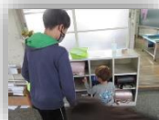
6年のやさしさに包まれて