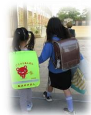
上級生といっしょに登校

子どもたちが、異年齢の仲間と関わり合うことで、心を成長させていく学校教育活動を今後も展開していきたいと考えています。