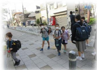
中学生 思いやる心