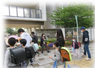
保護者 かるがも登校

この他にも、保護者の方によるかるがも登校・保護者の方による登校の見守り・隣の中学生のあたたかい心などなど、子どもたちが健やかに成長していくための環境が園田校区にはあります。このように子どもたちを真ん中にして、家庭・学校・地域が一体となって子どもたちを見守り支える、【響き合うそのだ】小学校になりますよう、保護者の皆様・地域の皆様、今後ともご理解ご協力の程よろしくお願い致します。