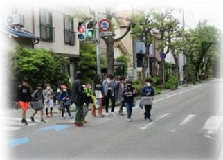
保護者の方の見守り