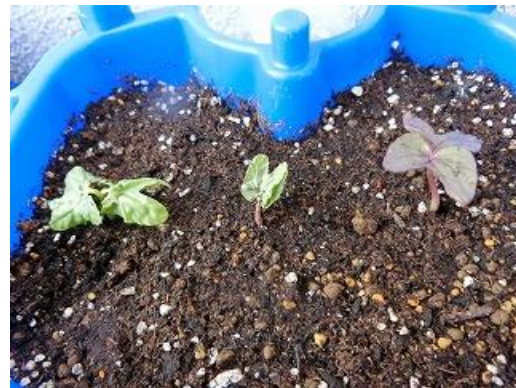
学校で先生が植えたあさがおの芽ができました

[園田東小ホームページアドレス http://www.ama-net.ed.jp/school/E42/index.html ]