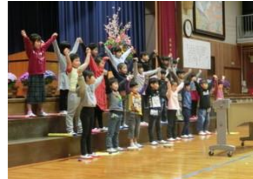
2年生による歓迎の歌と演奏です。1年間で、ずいぶん成長しました。