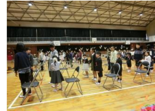
6年生の優しいお兄ちゃんお姉ちゃんに手を引いてもらって入退場しました。