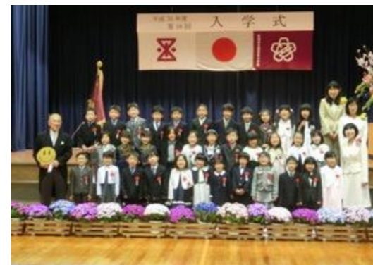
可愛い1年生は、初めて入った大きな体育館での入学式を無事に終え、園田東小学校児童の仲間入りをしました。左は1年生と担任と私です。右はそこに保護者が加わりました。結構たくさんいるように見えて嬉しいです。