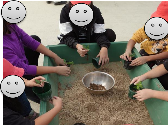
(5年生 自然学校行事にて 尼崎の森

[園田東小ホームページアドレス http://www.ama-net.ed.jp/school/E42/index.html ]