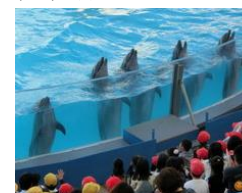
11/1 なかよし遠足 イルカとこんには。