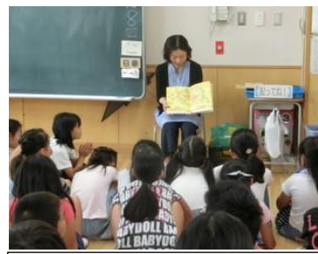
10/8 朝の読書タイム 3年生 本校保護者の図書ボランティアによる読み聞かせが始まりました。お母さんよろしくお祈りします!

組むのは音楽会です。場面に応じてメンバーや構成人数は変わりますが、どんな状況であっても『ONE TEAM』に向かって進み、お互いの思いを大切にしながら、一人一人の良さが生かされたチームづくりに取り組ませたいと思います。