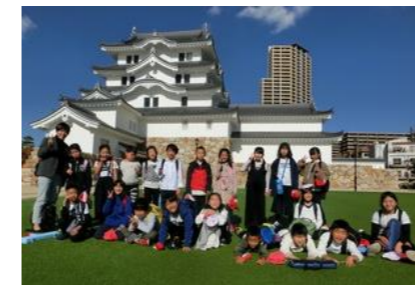
11/15 尼崎市小学校音楽会 立派に歌い演奏した後の ホッとしたひと時 4年生 お家の方の愛情弁当を 食べたあと、バスが来るま での待ち時間。すぐ近くに 『尼崎城』が見えたので、 なんと来てしまいました。

本当は『ONE TEAM』って難しい…。でも、”Smile!” 「とびっきりの笑顔!」はたくさん見ていただけたと思います。温かく拍手を送ってくださった皆様に感謝いたします。