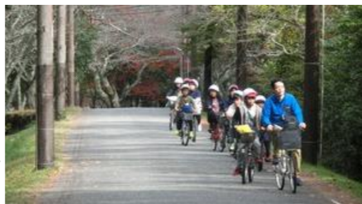
11/12 サイクリング 5年生 道の左側を上手に走っています。

さて、学校全体の行事、『音楽会』はいかがでしたか。保護者の方々だけではなく、おじいちゃん、おばあちゃんなどご家族の皆様、そして、ご来賓、地域の皆様にもたくさんお越しいただきました。温かく大きな拍手や励ましのお言葉をいただきましたこと、深く感謝いたします。にわか仕立ての教職員『SMILEバンド』(?)が奏でる、みんなで歌おう「パプリカ」には、アンコールの拍手をいただき本当にありがとうございます。『音楽会』でアンコールなんてやったのは初めてで、(子ども達が主役の音楽会なのに) えー? いいの? と思いながら、「もう一回やりたい」気持ちを満足させていただきました。皆様が目の前になってしまった6年生の恥じらいをよそに、1年生など「ノリノリ」の子ども達に合わせて突っ走ってしまいました…。そんな様子を皆様はどのようにご覧になられていたのでしょうか。