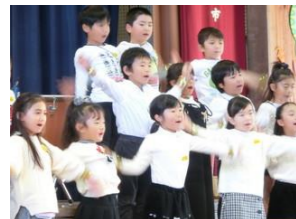
11/23 音楽会 上: 1年生 歌 下: 全児童 クラッピングフ ァンタジー第7番