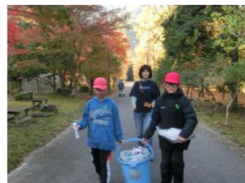
11/13 野外炊飯 5年生 カレー作りの道具運びです。