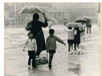
昭和30年代 雨の日の給食運び

23日(月)から給食週間が始まります。給食週間では、調理師さん達に感謝の気持ちを伝えたり、給食ビンゴゲーム・ランキング・世界の給食等を内容とする給食集会を実施します。さらに、セレクト給食や残食調査も行います。子ども達は、この1週間で「食」の大切さや給食についての関心を高めてくれる事でしょう。また、学校ホームページにおいては、「尼崎・上坂部地歴散歩」の第67話「学校給食と県内唯一の『あまにゅう』」、第68話「食の安全と学校給食」で、給食のあり方を紹介しています。どうぞ、ご覧ください。