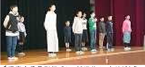
<児童会役員引継式> 新旧共々 ありがとう!

いよいよ巣立ちの時…20日(火)に第81回 卒業証書授与式を行います。6年間を過ごした学び舎には、きっとたくさんの思い出が刻まれていることでしょう。式には、5年生が在校生代表で参加します。1～4年生は、自宅学習になります。おうちで卒業を祝ってあげてください。