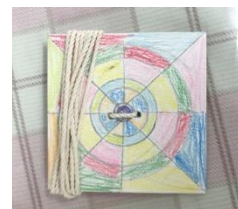
3年生 ぶんぶんごま