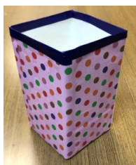
4年生 えんぴつ立て