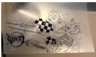
1年生 クリアフォルダ