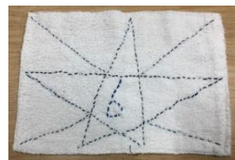
6年生からのお返し ぞうきん