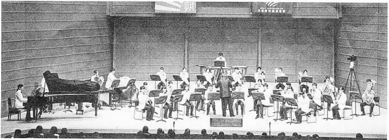
金賞 (西宮市長賞) 尼崎市立尼崎高等学校