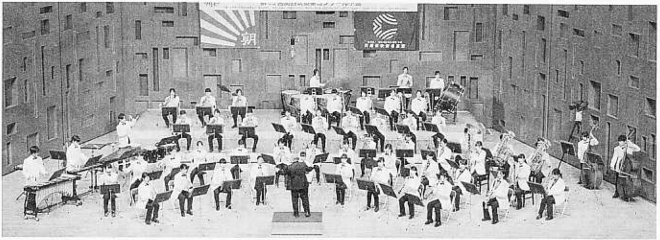
金賞 (兵庫代表・兵庫県知事賞) 尼崎市立尼崎高等学校