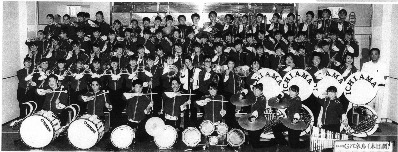
【写真】Gパネル(木目調)

中央中学校 中央中学校 テレビ朝日 京セラドーム 本校特別講義室 本校体育館 淀川工科高校 ベイコム野球場 本校体育館 中之島公会堂 あましんアルカイックホール 明石トーカロ球場 グリーンアリーナ神戸 あましんアルカイックホール 明石トーカロ球場 あましんアルカイックホール 阪神甲子園球場 阪神甲子園球場 阪神甲子園球場 立花商店街 カリカエ公園 阪神甲子園球場 姫路市文化センター あましんアルカイックホール 阪神甲子園球場 阪神甲子園球場 さんさんタウン あましんアルカイックホール 本校体育館 グリーンアリーナ神戸 立花南小学校 大阪市中央体育館 本校グラウンド ウイング球場(姫路市立姫路球場) JR立花駅南側 あましんアルカイックホール 神戸メリケンパーク イオン尼崎 あましんアルカイックホール あましんアルカイックホール