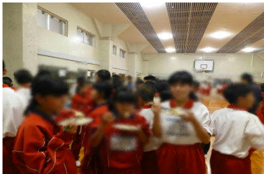
(みんなでおもちを食べました。)