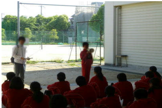
(これから出発です。)