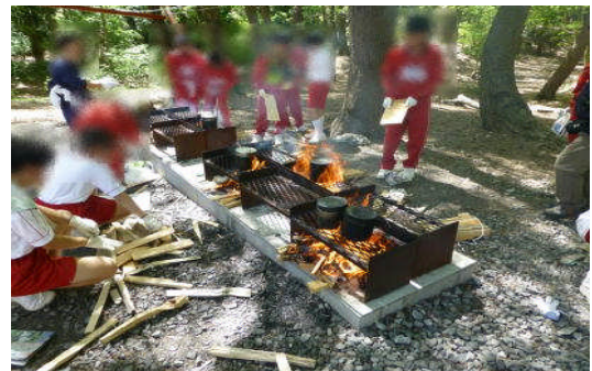
(2日目、カレー作りです。)