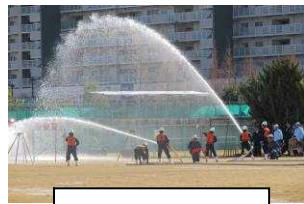
中央中での出初め式