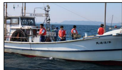
体験、船釣りの様子

3年生におきましては、この2泊3日の修学旅行で得たことを今後の学校生活に生かして欲しいと思います。