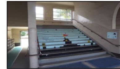
階段アーートの様子