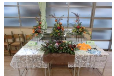
フラワーアレンジメント部

舞台発表では、はじめに各学年代表クラスによる合唱が行われました。どのクラスも少し緊張していましたが、素晴らしい合唱を聴かせてくれました。その中でもやはり3年生の合唱は圧巻でした。結果は3年3組が小田中学校の代表として、中高合同音楽会に出場することになりました。また、英語の暗唱・スピーチやトライやるウィークの発表、生徒会制作の映像、有志生徒によるキレキレのダンスなど見応えのあるものでした。