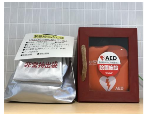
【小田中学校のAEDと緊急持ち出し袋】