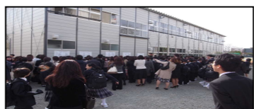
新入生の組分けの様子