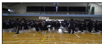
対面式での新入生の入場

4月12日に、1年生徒と2, 3年生で対面式を行いました。お互いが初めて顔を合わせる機会でした。それぞれ緊張した面持ちで対面式に臨んでいました。今後、仲良く、学校生活を送ってほしいと思っています。