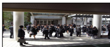
新入生の登校の様子

新入生の皆さん、ご入学おめでとうございます。皆さんは、これからは、小田中学校の一員です。そして、小田中学校第一回目の新入生です。そのことに誇りを持ち、勉強に、部活動に熱心に取り組んで下さい。まだ、慣れていないので分からないことが多いと思いますが、分からないところは、先生や先輩に教えてもらうようにしましょう。きっと丁寧に教えてくれると思います。年度の初めは、色々とやらなければならないことがたくさんありますが、コツコツとやっていって下さい。