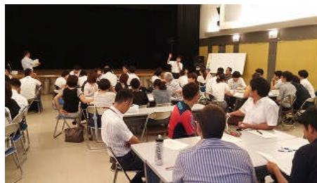
小中合同研修の様子

夏期休業中の教職員は学校単位でまたは、個人としても数多くの研修に参加します。小田中学校でも7月29日（土）に浜田小学校・大庄北中学校で開催されました兵庫県人権教育研究大会阪神地区大会へ参加し、「進路・学力保障」「仲間作り」「多文化共生」などの分科会で研究報告や協議を行いました。また、8月1日（火）には、小田中学校区の4小学校（杭瀬小、長洲小、浦風小、清和小）と合同で「カリキュラムや生活のきまり」について市教育委員会から指導主事を招き、小中連携の研修を行いました。