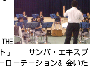
たそがれコンサート