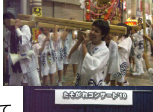
たそがれコンサート