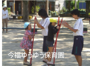
今福ゆうゆう保育園