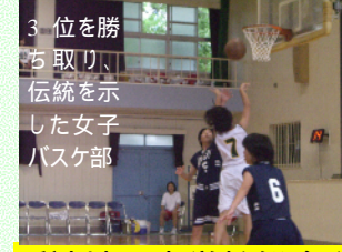
3位を勝ち取り、伝統を示した女子バスケ部