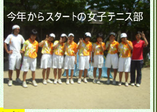
自力はある野球部