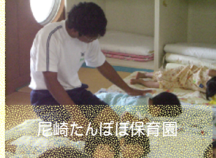
尼崎たんぼ保育園