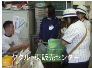
ヤクルト東販売センター