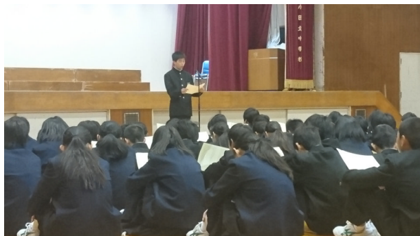
(人権作文：3組小助川君)

個人の成長は、集団の成長にもつながります。お互いの頑張りを認め合い、励まし合い、これまで以上にそれぞれの成長が、この学年の大きな成長につながっていけばと思います。