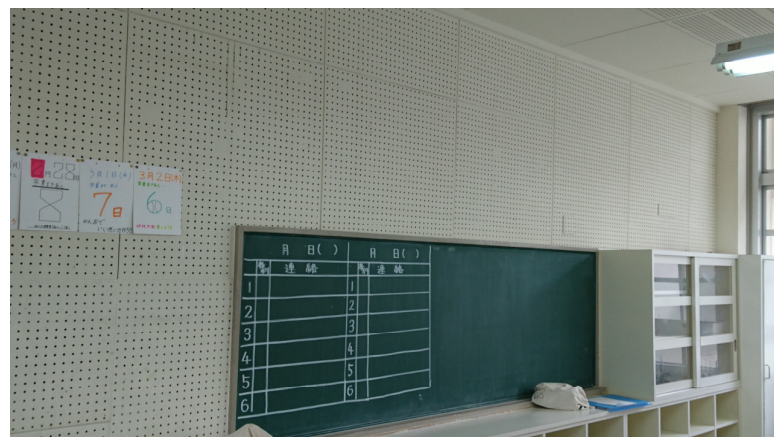
3年生のある教室 思い出をココロは詰めて 自分たちで教室の整備