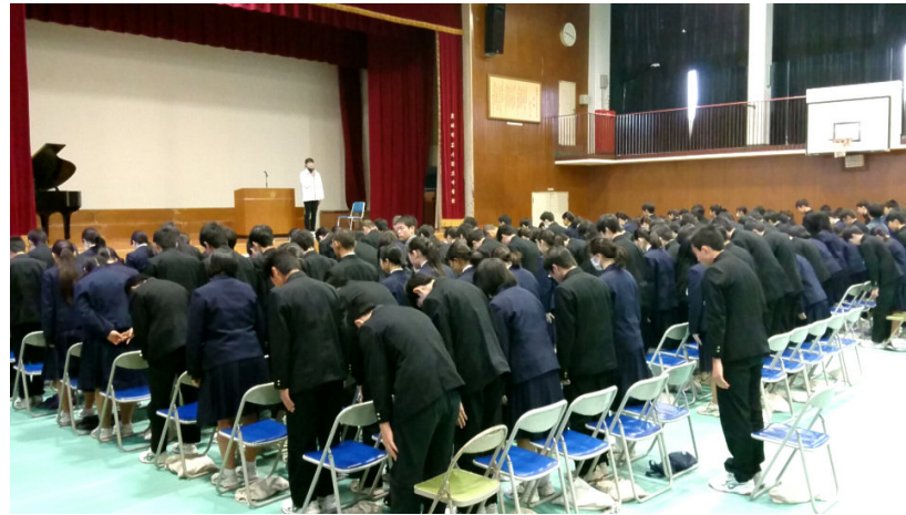
練習中の3年生の姿 3年生の背中を追いかけることができるのは 10日の卒業式までです