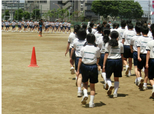
入場行進の練習中 足並みをそろえて、手をしっかり振って！

6月10日(土)に開催される体育大会(雨天時は6月13日(火)に延期)に向けて、入場行進やラジオ体操などを、2、3年とともに練習しています。まだまだ、上級生には及びませんが、元気いっぱいな演技を見せてほしいところです。