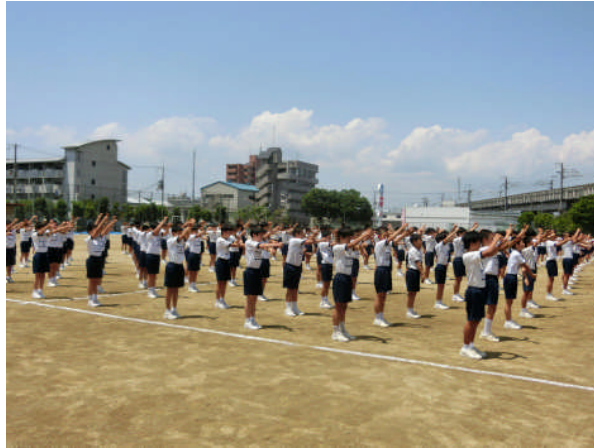
ラジオ体操の練習中 演技のひとつだという意識で、手を抜くな！