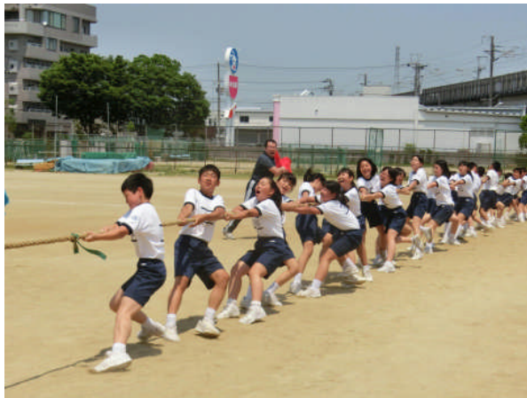
予選2位通過、本選で下克上を狙う1組