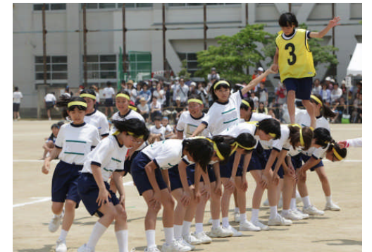
こんな感じの競技です (写真は昨年度のもので)

クラスの団結と協力が試される種目です。練習するたびに、順位の変動があるので、本番ではどのクラスが1位になるのか、楽しみです。