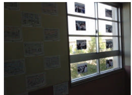
4階 “宿泊学習ロード”

← 第1理科室は、理科や数学の夏休みの作品展。黒板には市理科作品展代表の作品が掲示されていました。