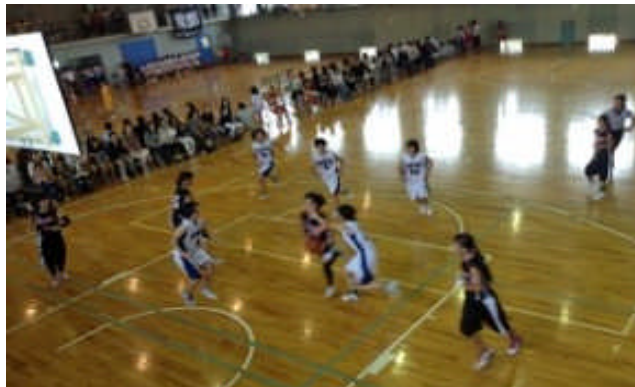
<月末に県大会を控える女子バスケット>