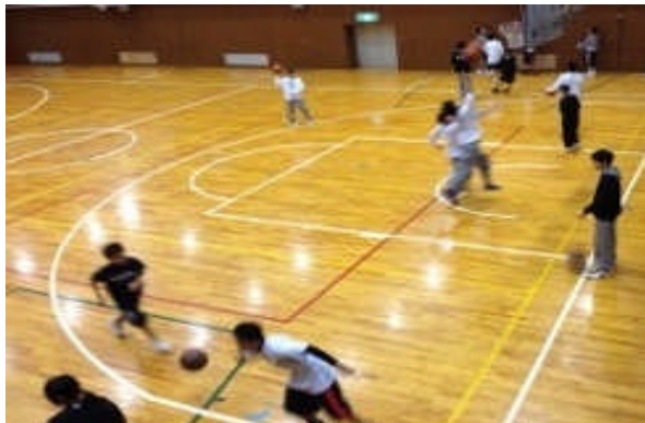
<公式戦1勝を目指す男子バスケット>