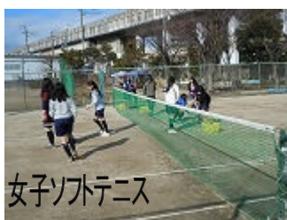
女子ソフトテニス