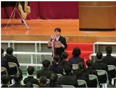
在校生歓迎の言葉