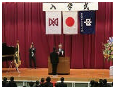
新入生誓いの言葉