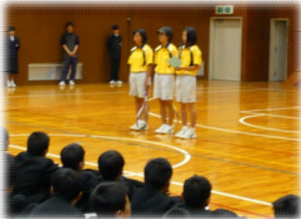
「一番練習が長い」との女子テニス部。

尚、新年度当初の生徒会行事では、生徒会執行部が司会・進行などを務め、素晴らしい運営でした。その陰には前日までの準備があるということを知っていますね。始業式より連日、大変だったことでしょう。ご苦労様でした。感謝。