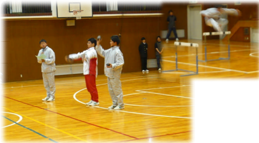
←陸上部（男女） 短・長距離・投てき・跳躍など 多彩な活動が出来る