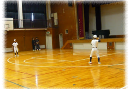
合同チームの脱出が出来るか野球部