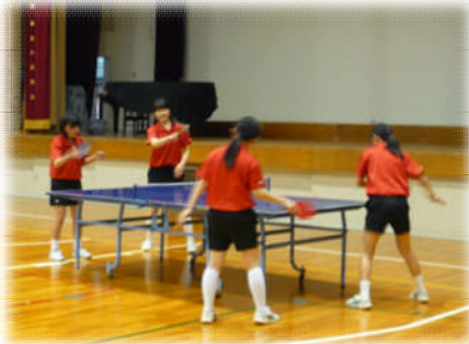
カラフルなユニフォームで打ち合う女子卓球