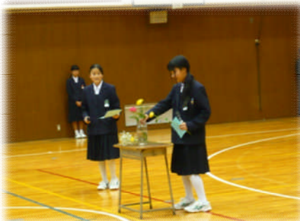
簡単な生け花の実演「妙に納得しました」創部2年目に突入した女子バスケット