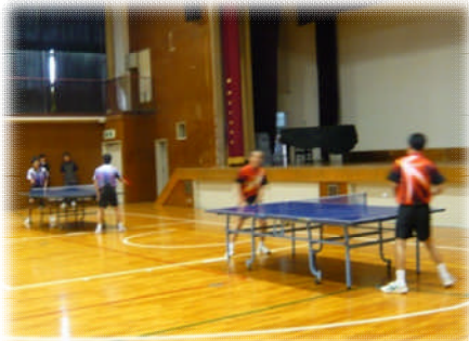
「卓球王国」復活を目指す男子卓球部