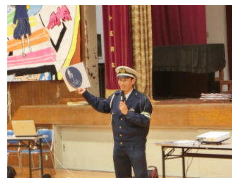
こんな標識を知っていますか？

平坦な地形の尼崎市。プライベートや部活動での移動など、自転車を利用する機会が多いはず。その時は、安全教室で教えていただいた内容を思い出し、くれぐれも事故のないように心がけてください。