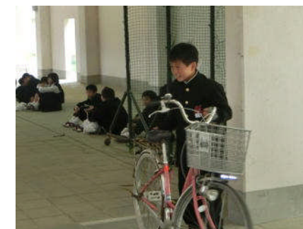
しっかりと、安全確認して・・・ さあ、出発！