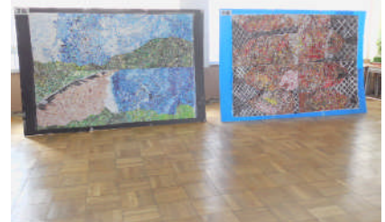
北校舎は、各学年の総合学習での展示。3年生は「修学旅行」（左）、2年生は「トライやる」（真ん中）、1年生は「宿泊学習」と行事を新聞にまとめました。1年生は、佐津の風景をちぎり絵でまとめました。大変だったでしょう…