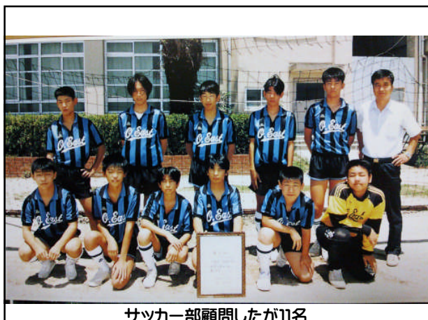
サッカー部顧問したが11名