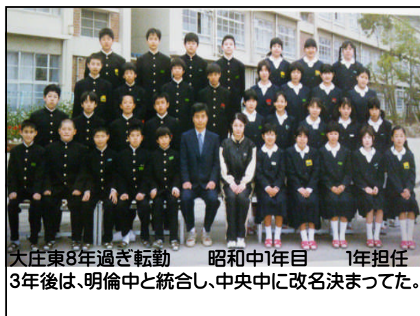
大庄東8年過ぎ転勤 昭和中1年目 1年担任 3年後は、明倫中と統合し、中央中に改名決まった。

昭和中学校 平成15年4月～平成19年3月 尼崎市立昭和中学校・ 中央中学校時代