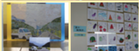
3階美術室及びその前の廊下はちょっとした美術館の様相でした。